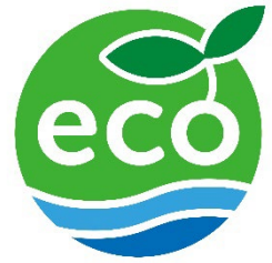
「理研ビタミンのeco」マーク

マーク周辺には「ボトルの一部に再生PET原料を使用」と具体的な取り組み内容を併記します。