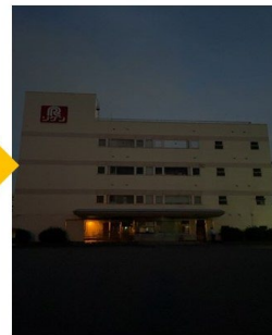
昨年のライトダウン実施の様子（左：理研ビタミン本社、右：草加工場）