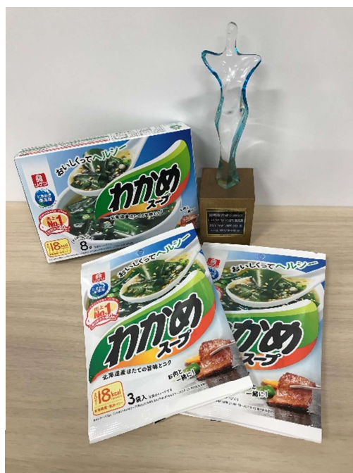
受賞商品の展示とトロフィー▶