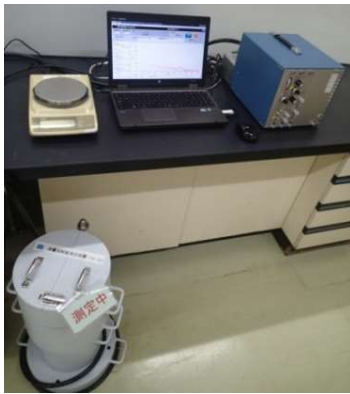
放射性物質検査装置

また、これらの原料を使用して製造している乾燥カットわかめ等の三陸産わかめ関連製品につきましても、製造日毎に検査を行っており、 現在まで放射性物質は検出されておりません。