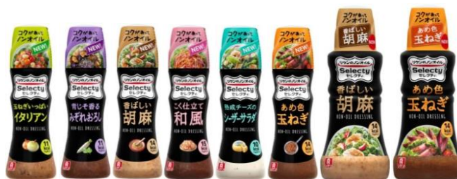
「リケンのノンオイル セレクトィ。」シリーズ

F S C®マークは、その製品に使われている原材料が責任を持って調達されたことを意味しています。F S C®マークのついた製品を選ぶことで、責任ある森林管理を世界に広げ、森林を大切にすることにつながります。