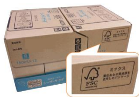
F S C®マークの入った段ボール